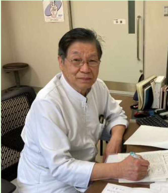
筆者：加藤 至 （日本形成外科学会認定専門医）

「形成外科」という医療が日本で本格的に始まって、まだ60年ほどですので、なじみのない方もいるでしょう。外国では3000年前には行われていたようです。当時は刑罰や奴隷の印として鼻を切り取っていましたが、これを直すのに額や頬の皮膚を使って鼻をつくった記録があります。